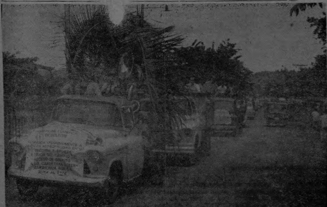
Magnífica gráfica del desfile de vehículos que se llevó a cabo el domingo 4 de Setiembre en Golfito, en respaldo a la Municipalidad por su decisión de apoyar la Ruta al Este que une directamente al Puerto de Golfito con las zonas de Coto, Cañas Gordas y La Cuesta, entroncando finalmente con la Carretera Interamericana.