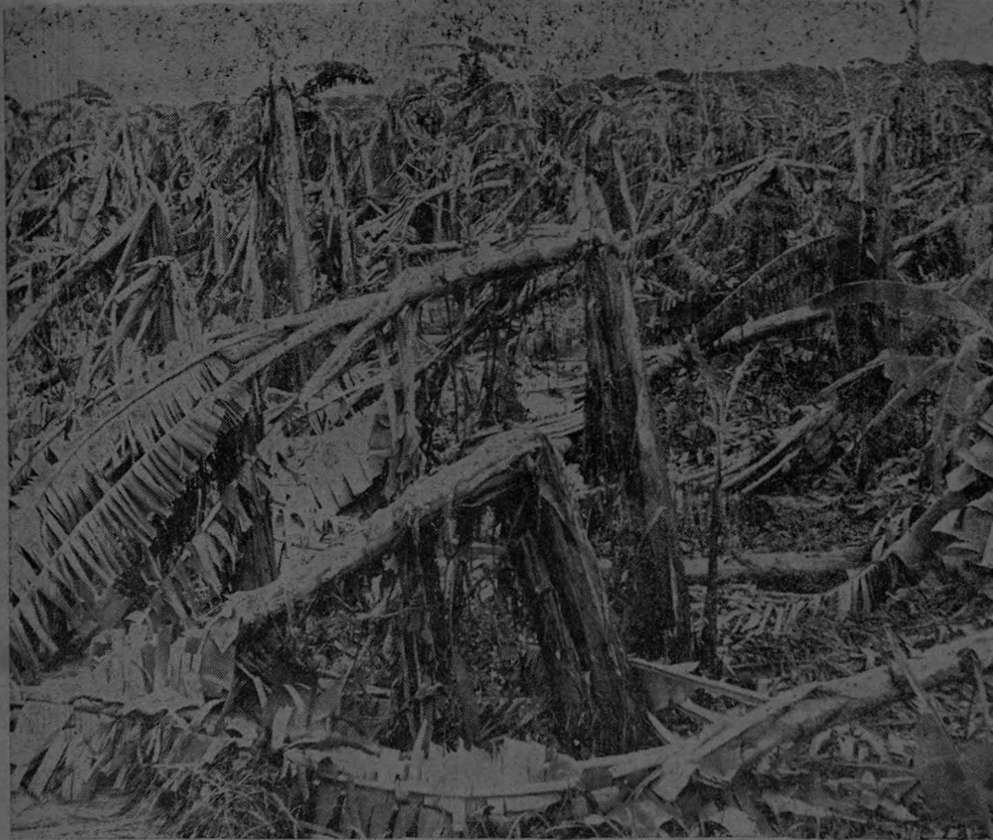
Este es el saldo del violento vendaval que azotó el distrito de Colorado.